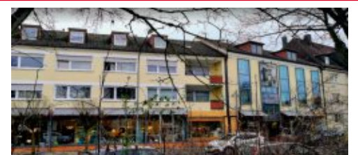
Öffnungszeiten: Mo.-Fr. 9.30 bis 18.00 Uhr, Sa. 9.30 bis 16.00 Uhr